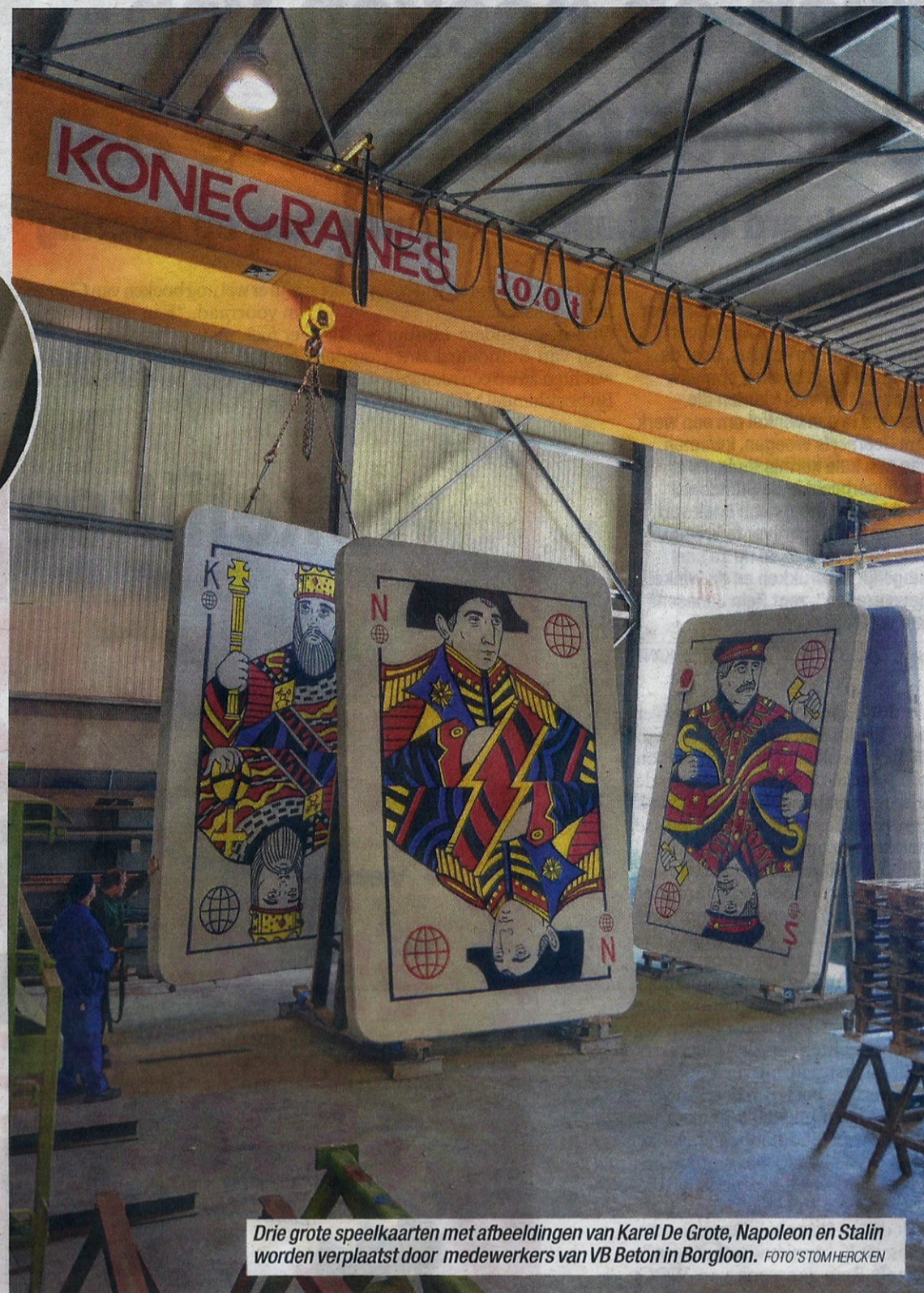
Drie grote speelkaarten met afbeeldingen van Karel De Grote, Napoleon en Stalin worden verplaatst door medewerkers van VB Beton in Borgloon.

Het werk bouwen kost heel wat inspanning. De platen van gewapend beton worden door VB Beton in Borgloon in mallen gegoten. "Dan schuur ik alle oppervlaktes glad en zet ik er witte lagen verf op. De figuren zet ik er handmatig op met penseel, acrylverf en spuitbus. Voor de achterkant van de speelkaarten werk ik met een sjabloon. Ook daar zitten kritische verwijzingen in. Zo zie je aan de rand van de kaarten prikkeldraad. De pauwenveren op de achterkant verwijzen naar het vergankelijke